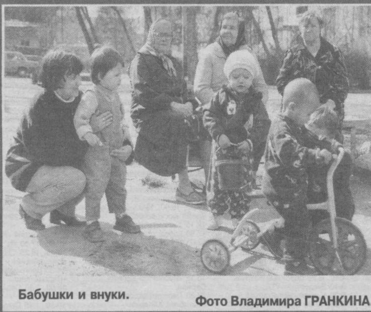
Бабушки и внуки.