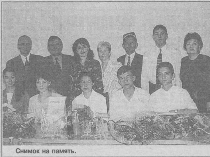
Снимок на память.

употребления, тесты дают объективную картину. Но при этом невозможно разглядеть творческие задатки участников, будь то умение неординарно мыслить, выразительно декламировать или иметь хорошие навыки в лабораторной работе, если это касается естественных наук. Тестами можно проверить лишь общую подготовку, хорошую память ученика и его наработки "методом" зубрежки. Но недостаток тестовой системы заключается в том, что ориентация лишь на нее приучает школьников мыслить шаблонно, в то время, когда наиболее важным повсеместно считается демонстрация творческого подхода и наличие собственных суждений, разумеется, при хорошей базовой подготовке.