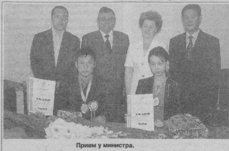
Прием у министра.

Защищать честь Узбекистана в IV Международном соревновании мате-