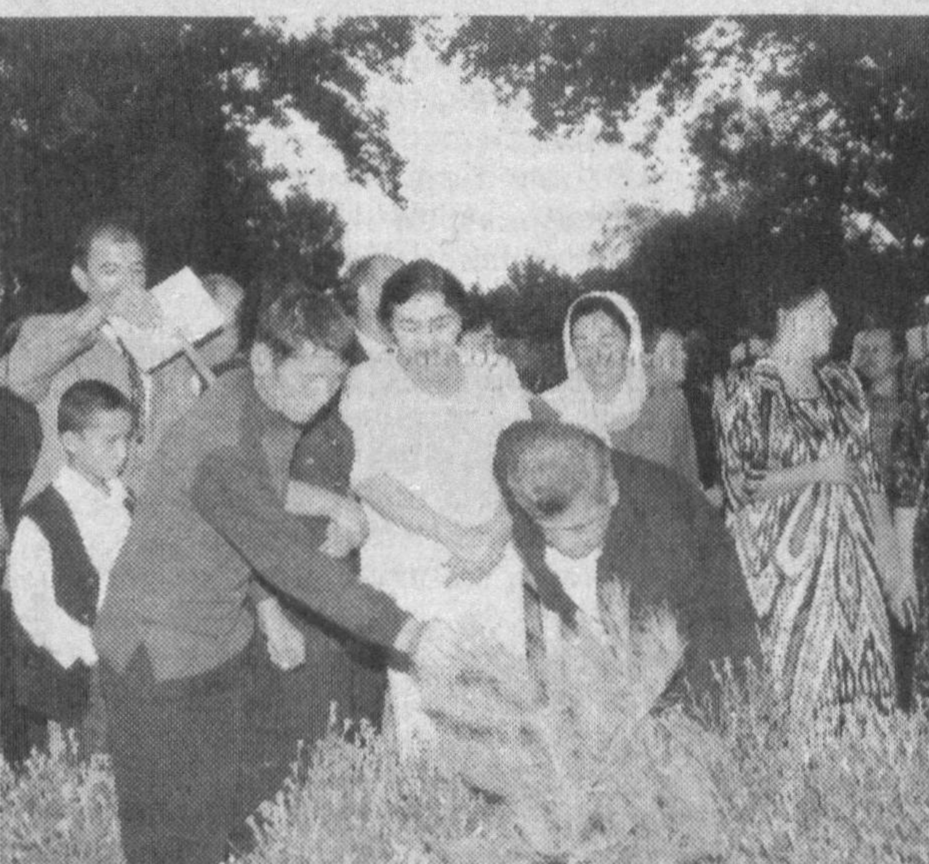
Фарғонага бораримда йўлдош бўлди Неча шоир, неча носир дўст-ёрларим. Бири дилдош, бири эса кўлдон бўлди, Улар эди бовуларим, жигарларим.