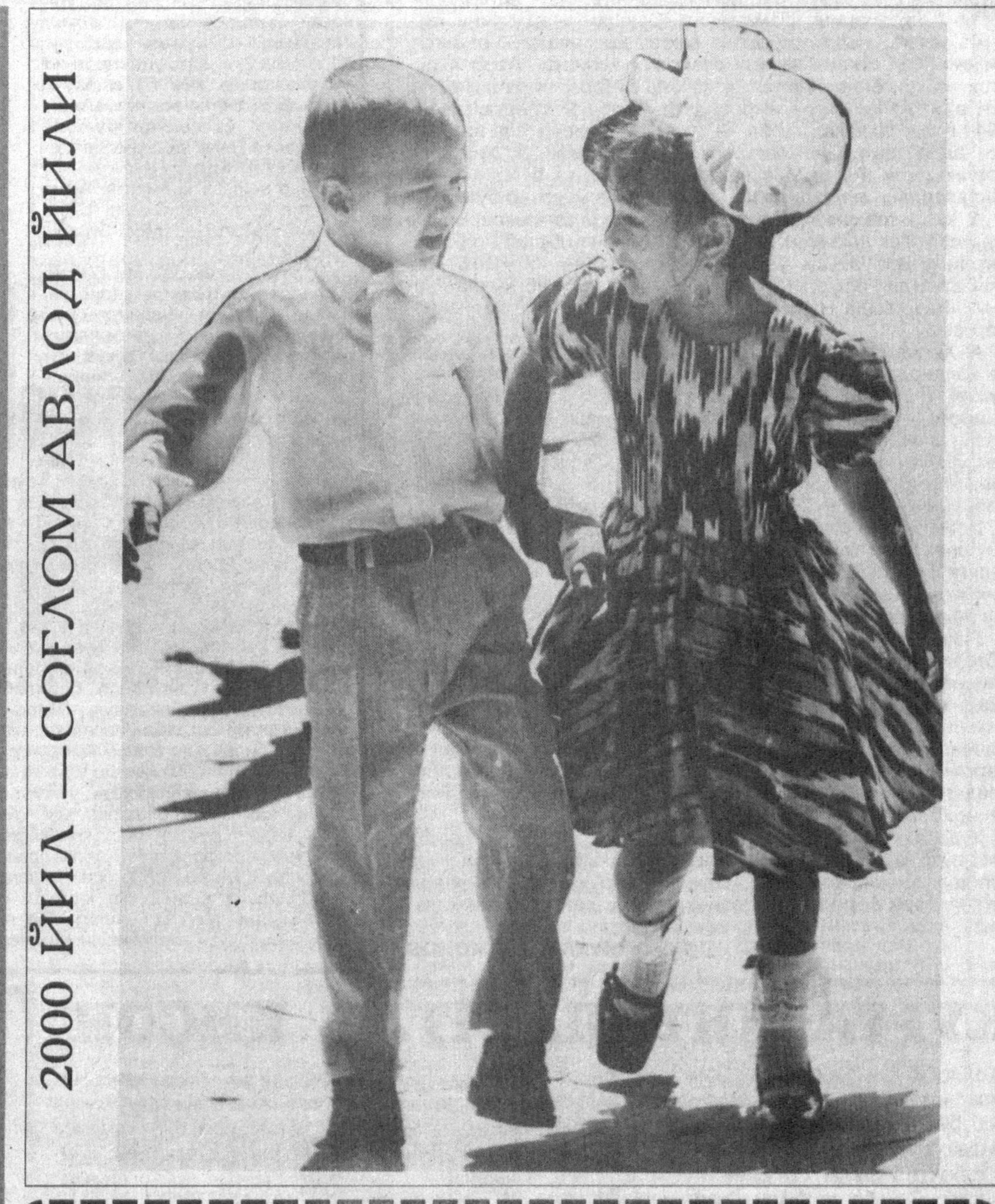
2000 ЙИЛ — СОҒЛОМ АВЛОД ЙИЛИ

Ҳар бир суратини чизиб берганки, ўқиб-ҳайратга тушасан киши. Китобни ёзиш жараёнида олима 600дан зиёд манбалардан фойдаланган. Ана шу тарихий асарларга асосланган ҳолда Заҳириддин Бобурга — фирдавсмақоний, Насируддин Хумоюнга — жаннат ошиёний, Жалолуддин Акбарга — арш ошиёний, Нуриддин Жаҳонгир Шоҳ Жаҳонга — соҳибқирон, Аврангзёб Оламгирга — худд макон каби нисбатлар берган.