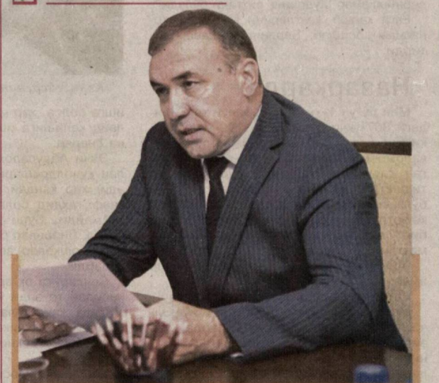
Раҳмат МАМАТОВ, Ўзбекистон Республикаси Маҳалла ва оилани қўллаб-қувватлаш вазири:

— Давлатимиз раҳбари томонидан ҳар бир оила, кўча ва маҳаллаларимизда “Обод хонадон — обод кўча — обод маҳалла” тамойилини кенг жорий этиш бўйича белгилаб берилган вазифаларни барчамиз, аввало, ўз иш услубимиз учун асосий тамойил сифатида белгилаб олишимиз, бу гоёларни кенг жамоатчилигимиз орқали халқимиз турмуш тарзи ва маданиятига синдиришимиз лозим.