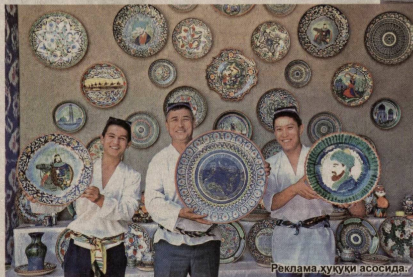
Реклама, ҳуқуқи асосида.

риқларни самарали ижро этиш йўлида фаол ишлар амалга оширилмоқда. Бош банкда янги тузилма – Кулолчиликни қўллаб-қувватлаш бошқармаси ташкил этилди, минтақавий филиалларда масъул ходимлар тайинланди, вилоят ва туманлар ҳокимликлари билан яқин ҳамкорликда “Йул харитаси” ишлаб чиқилиб, дастлабки ишлар бошлаб юборилди.