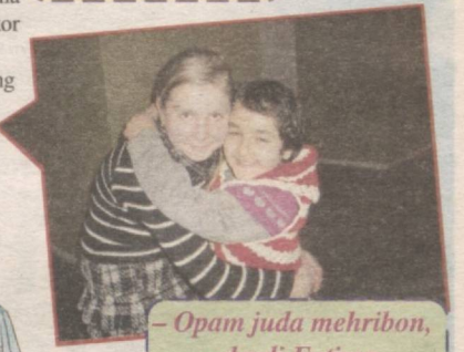
Opam juda mehribon, – deydi Fotima.