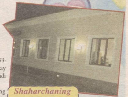
Shaharchaning bir uyi.