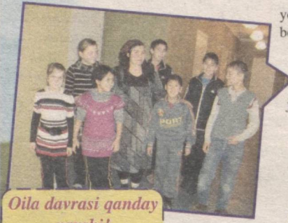
Oila davrasi qanday yaxshi!