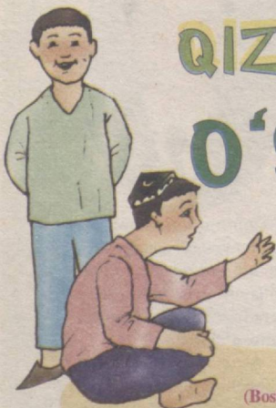
(Boshi o'tgan sonlarda)

Janobi elchi kula-kula rozi ham bo'lib, yangi yil arafasida oltin qafasga solingan, kekkayib turgan bo'ydor xo'rozlardan oltitasini o'smiring uyiga yetkazib beribdi. O'smir bu xo'rozlardan besh-o'n kun zavqlanibdi, nihoyat, Tagobdagi xo'rozlarni urishishga qo'rgan ekan, chatoq bo'pti, juda chatoq