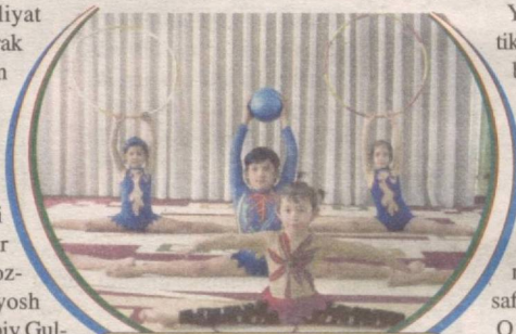
Suratda: yosh gimnastikachilar mashg'ulot paytida.