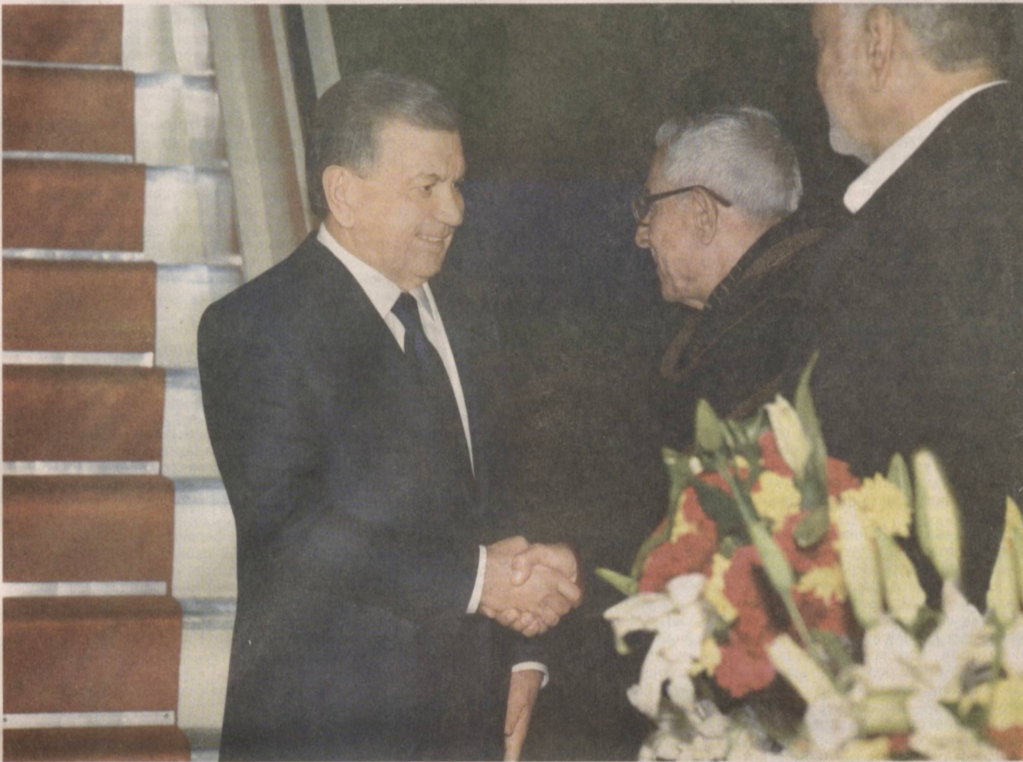
Ахмадабад, 17 января. Сообщает специальный корреспондент УЗА Умар Асроров.

Президент Республики Узбекистан Шавкат Мирзиёев по приглашению Премьер-министра Республики Индия Нарендры Моди 17 января прибыл с рабочим визитом в город Ахмадабад штата Гуджарат.