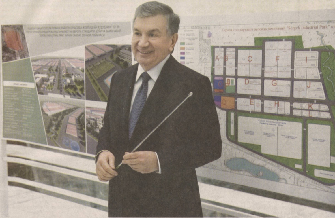
Президент Республики Узбекистан Шавкат Мирзиёев 24 января ознакомился с инвестиционными проектами, которые намечено реализовать в городе Ташкенте в 2019 году.

Глава государства на состоявшейся 21 декабря 2018 года внеочередной сессии Ташкентского городского Кенгаша народных депутатов отметил необходимость привлечения в столицу представителей крупного бизнеса и потенциальных инвесторов, создания в городе максимально благоприятного инвестиционного климата.