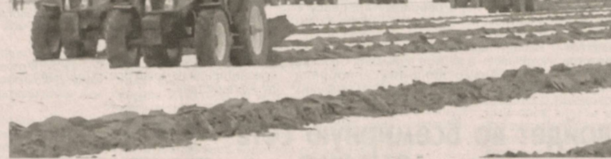
Международное сообщество откликнулось на инициативы лидера Узбекистана. По инициативе нашего Президента при ООН создан многопартнерский Тростовый фонд по человеческой безопасности для региона Приаралья, в который уже поступают средства от доноров из разных стран на реализацию проектов по улучшению условий жизни проживающих там людей.

вопросов. Например, смог бы Узбекистан сегодня прокормить более 33 миллионов человек, если бы в свое время здесь не довели площадь орошаемых земель с 1,8 миллиона до 4,3 миллиона гектаров? Да, в основном земли осваивались под хлопчатник, а многие продукты питания завозились из-за пределов Узбекистана. Это была политика союзного центра. Но нетрудно представить, что было бы после развала Союза, если бы не освоены ранее земли. Продовольствие пришлось бы закупать за валюту, которой у независимой республики не было. Достаточно сказать, что в первые дни после обретения суверенитета в Узбекистане зерна оставалось максимум на неделю. Кстати, тогда и в последующем как раз и помогло то, что за счет экспорта хлопкового волокна страна зарабатывала значительную часть валюты, на которую закупалось продовольствие, в первую очередь зерно. Вторая причина того, почему, зная о негативных последствиях для Арала, все же шли на масштабное освоение земель и огромные затраты вод-