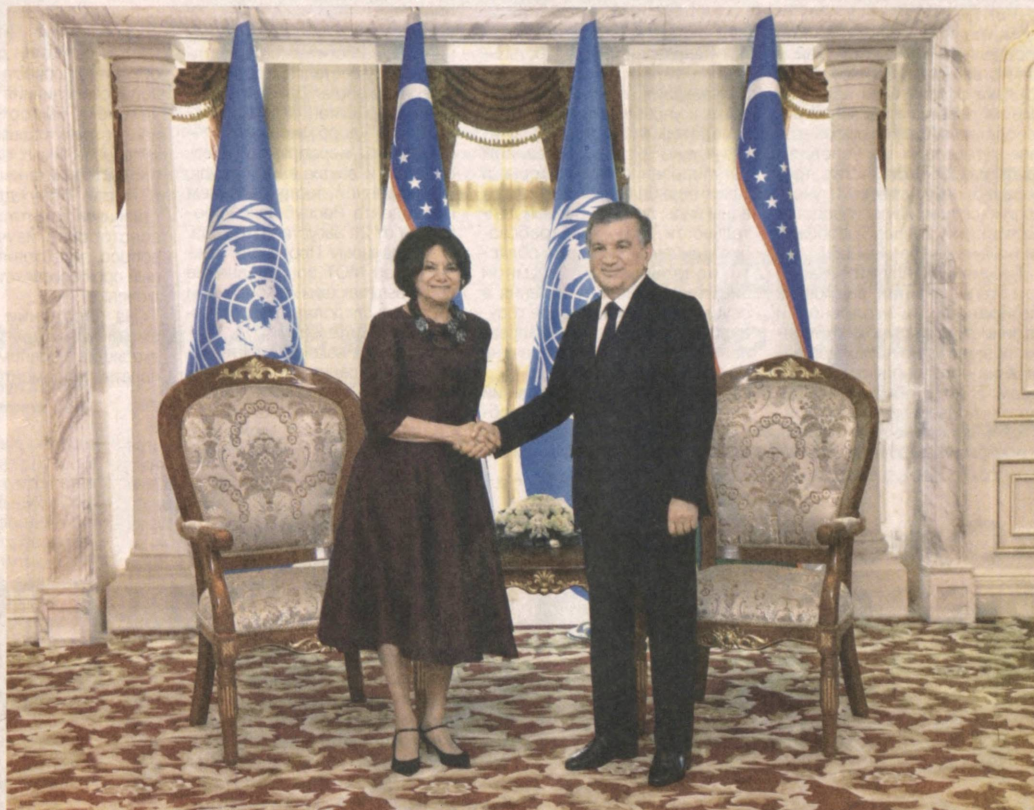
Бишкек, 13 июня. Сообщает специальный корреспондент УзА Зиёдулла ЖОНИБЕКОВ.

В международном аэропорту «Манас» главу нашего государства встретил Премьер-министр Кыргызстана Мухаммадали Абилгазиев.