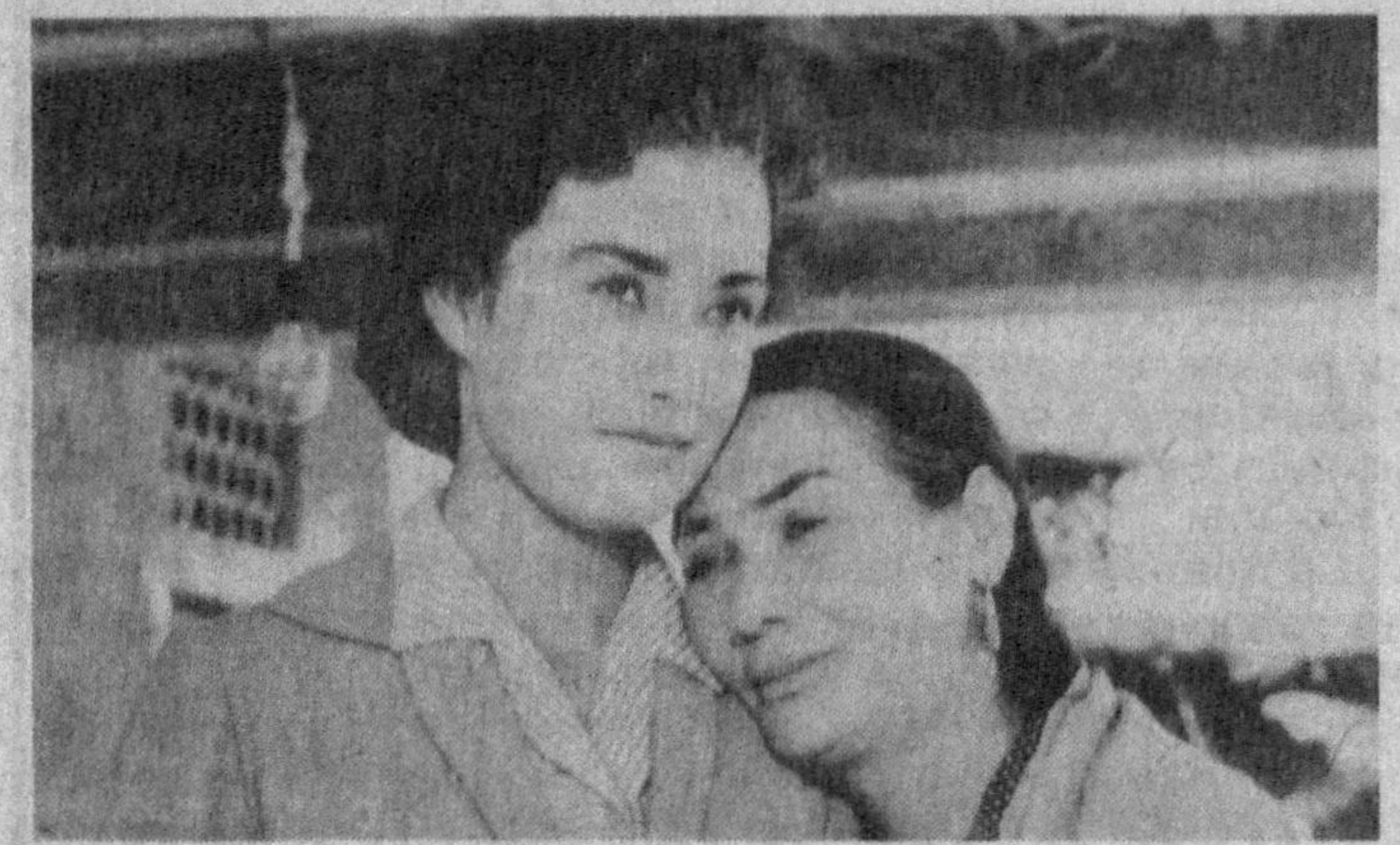
«Махаллада дув-дув гап»