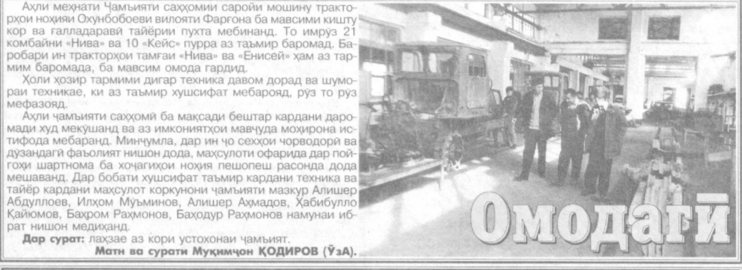
Омодаги. Дар сурат: лаваз аз кори устохонаи чамбият.