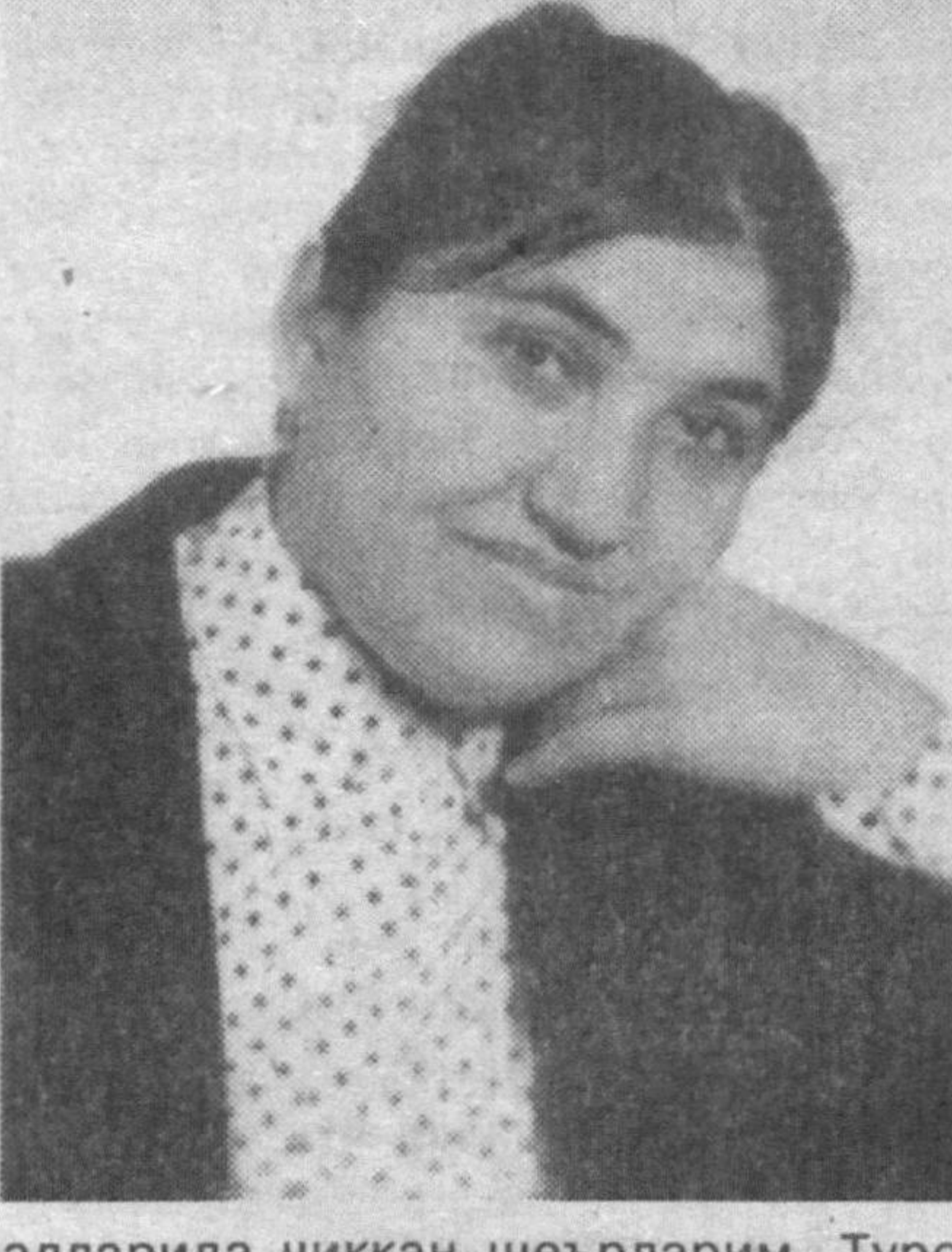
наларида чиққан шеърларим. Туроб Тула, Шукр Холмиров...

Тоннинг зилол нафасин ичиб, Бир илиқлик югурди танга.