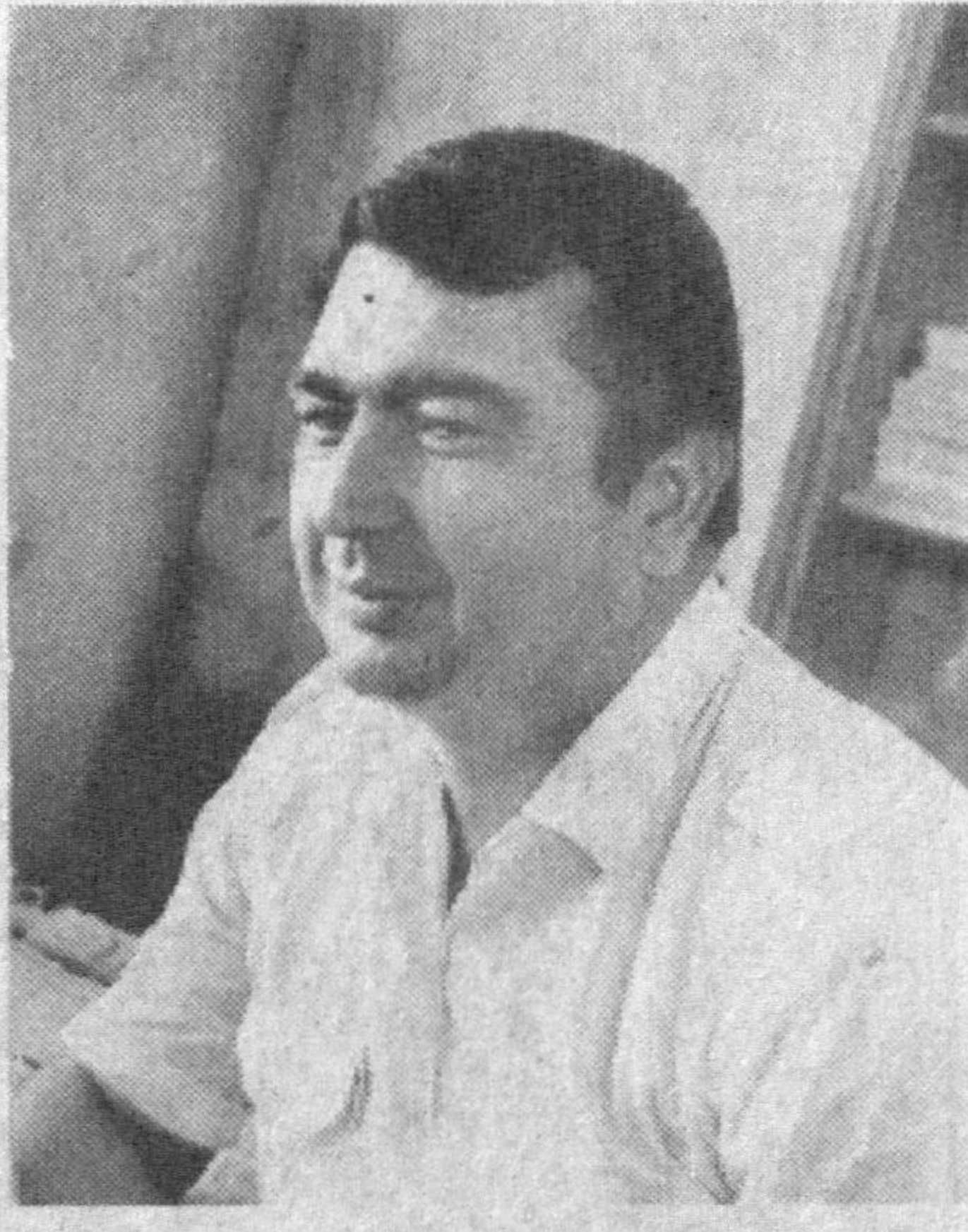
Гар бепарво бўлиб қолсақ гоҳ, “Муқаддасдир мисли саждагоҳ” — Пайғамбарлар айлаган оғоҳ Гапларидан бошлар Ватан.

Назокатли гулзун баҳорнинг, Масканидир гуруринг, орнинг, Садоқатли сеvimли ёрнинг Лабларидан бошлар Ватан.