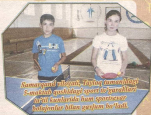
Samarqand viloyati, Tayloq tumanidagi 5-maktab qoshidagi sport to'garaklari ta'til kunlarida ham sportsevar bolajonlar bilan g'ujum bo'ladi.

Mana, yurtimizda yana bir o'quv yili yakunlanib, o'quvchilar orziqib kutgan yoz fasti ham bostlandi. Quvonarlisi, ortda qotgan o'quv yilida ham bilimga chanqoq, intiluvchan yoshlarimiz o'z bilim va ko'nikmalarini mustahkamlab, barcha fanlardan yuqori baho olib, ota-onasi, ustozlari ishonchini oqlashdi. Endi soya-salqin, bahavo go'shalarida, so'lim oromgozlar bag'rida har qancha dam olsalar, yarashadi.