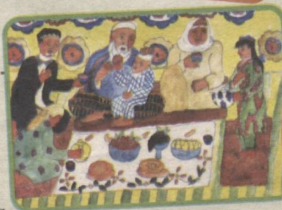
Shahlo RUSTAM qizi