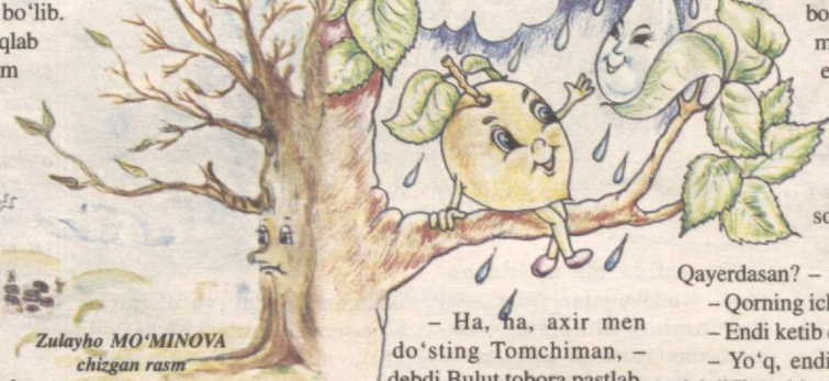
Zulayho MO'MINOVA chizgan rasm

- Ha, ha, axir men do'sting Tomchiman, - debdi Bulut tobora pastlab. - Qanday qilib osmonga chiqib olding, meni ham olib ket, - debdi O'rik havasi kelib. - Meni Quyoshbobo bulutga chiqarib qo'ydi. Lekin sen yerda yashashing, odamlarga meva berishing kerak. Men yana yoningga qaytaman, - degancha bulutlarga qo'shilib olishabdi Tomchi. O'rik yana yolg'iz qolibdi. Kynlar borgan sayin isib, O'rikning rosa suv ichgisi kelibdi. Chanqog'ini qondiray