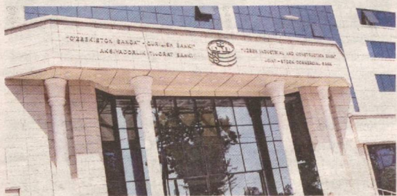
(Давоми. Бошланиши 1-бетда).

Лойиҳа уч босқичда амалга оширилади. Бунинг учун «Ўзсаноатқурилишбанк» АТБ томонидан 12 млрд. сўм (Хитой давлат тараққиёт банки кредит линиялари ҳисобидан 1,5 млн. АҚШ доллари) миқдоридаги имтиёзли кредит маблағлари йўналтирилади.