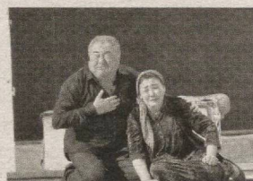
«ДИЛДАГИ ДОҒ» спектаклидан

Шунингдек, банк театримизнинг моддий-техник базаси мустаҳкамла-ниши, зарур барча техник жиҳозлар хариди учун ўз ёрдамини ямади. Агар бу кўмакларни рақамларда айтадиган бўлсам, ўтган икки йил