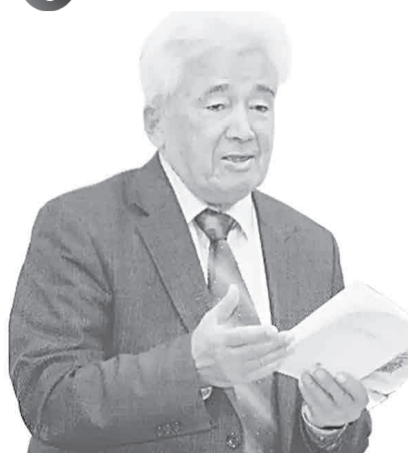
Omon MATJON (1943–2020-y), O'zbekiston xalq shoiri