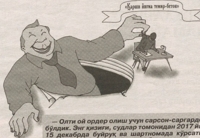
Бегали ЭШОНҚУЛОВ чизган сурат.

Бугун давр шид-гармоқда. Одамларнинг дунёқараши, тафаккури юксал-япти, яшаш, ҳаётга қараш ҳам шунга яраша тус оляпти. Аммо шундай қайноқ ва қизгин паллада ҳам айрим раҳбарлар ўз тўнини ҳануз ўзгартиргани йўқ.