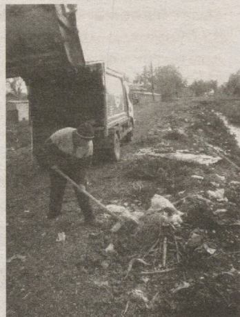
чиқиндилар «Тоза ҳудуд» корхонаси томонидан олиб чиқиб кетилди.

Ўзбекистон экологик ҳаракати Сирдарё вилояти ҳудудий бўлини маси томонидан Боёвут ҳамда Мирзаобод туманларидаги мавжуд чиқиндиҳоналарда санитария-гигиена талабларига риоя қилиниши юзасидан экологик рейд ўтказилди.