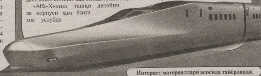
Интернет материаллари асосида тайёрланди.

Бундан ташқари, муҳандислар оролининг маҳаллий ўзига хослиги — тез-тез зилзилалар содир бўлишини ҳам эътиборга олган. Тезюрар поездда махсус механизмлар мавжуд бўлиб, улар содир бўлиши мумкин бўлган табиий офат оқибатларини бартараф этишга ёрдам беради.