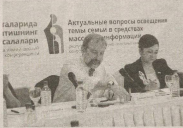
галарида итишининг салалари да илғиво лавабий конференцияда Актуальные вопросы освещения темы семьи в средствах массовой информации

«Болагимизда чироқ ўчиб қолса, ҳаммамиз бувимнинг атофида жамулжам бўлардик. Айниқса, қишнинг узун кечаларида, шамчироқ ёруғида эртақ ва ҳикоялар эшитиш биз учун мароқли эди. Бувим «Самарқанд дарвоза»да Абдулла Қодирий билан бир маҳаллада катта бўлган. Шу боис, Қодирийнинг ёшлиги, ижод оламига энди кириб келаётгани ҳақида жуда кўп гапириб берарди. Бувимнинг панд-насихатлари, бир-биридан қизиқ ҳикояларини тинглаш учун ҳам чироқ ўчишини интиқ кутардик. Оила деганда кўз ўнгимда мана шу манзаралар гавдаланади. Ҳозирги бобо-бувилар ҳам шундайми? Атрофига набираларини тўглаб, эртақ айтиб беришадими? Йўқ. Чунки бугунги болалар, бугунги бобо-бувиларнинг аксарияти интернетдан бўшамайди...»