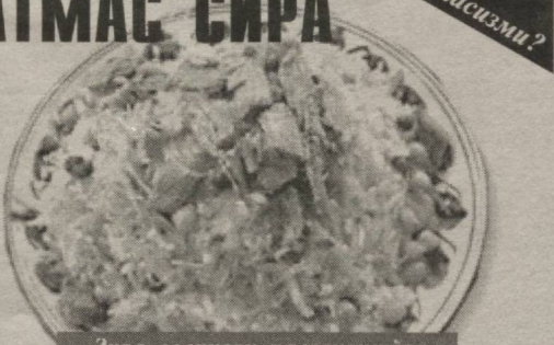
Зира солинган паловхонтўра хуштаъм ва хушхўр бўлади.

Маълумотларга кўра зира иштаҳани очибгина қолмай, меъда атрофидаги нохуш оғриқлардан, силлиқ мушаклар тортилишидан халос қилади ва ичак, қовуқ, сут безларининг фаолиятини яхшилайдди. Сурункали жигар касалига зирадан яхшироқ даво йўқ.