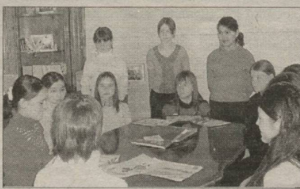
Кадрлар тайёрлаш миллий дастурида кўзда тутилган вазифалар тўлиқ амалга оширилмоқда.

Шундан бўлса керак, тарбияланувчилар шаҳарда ўтказиладиган барча тadbирларда фаол қатнашиб, совринли ўринларни эгаллаб келишмоқда. Ўз фондида 4000 дан ортиқ китоб тўпланган мўъжазгина кутубхона ҳам болалар хизматида. Тарбиявий жараён — маънавий-маърилай, эстетик тарбия, меҳнат ва касбга йўналтириш ишлари мунтазам йўлга қўйилган.