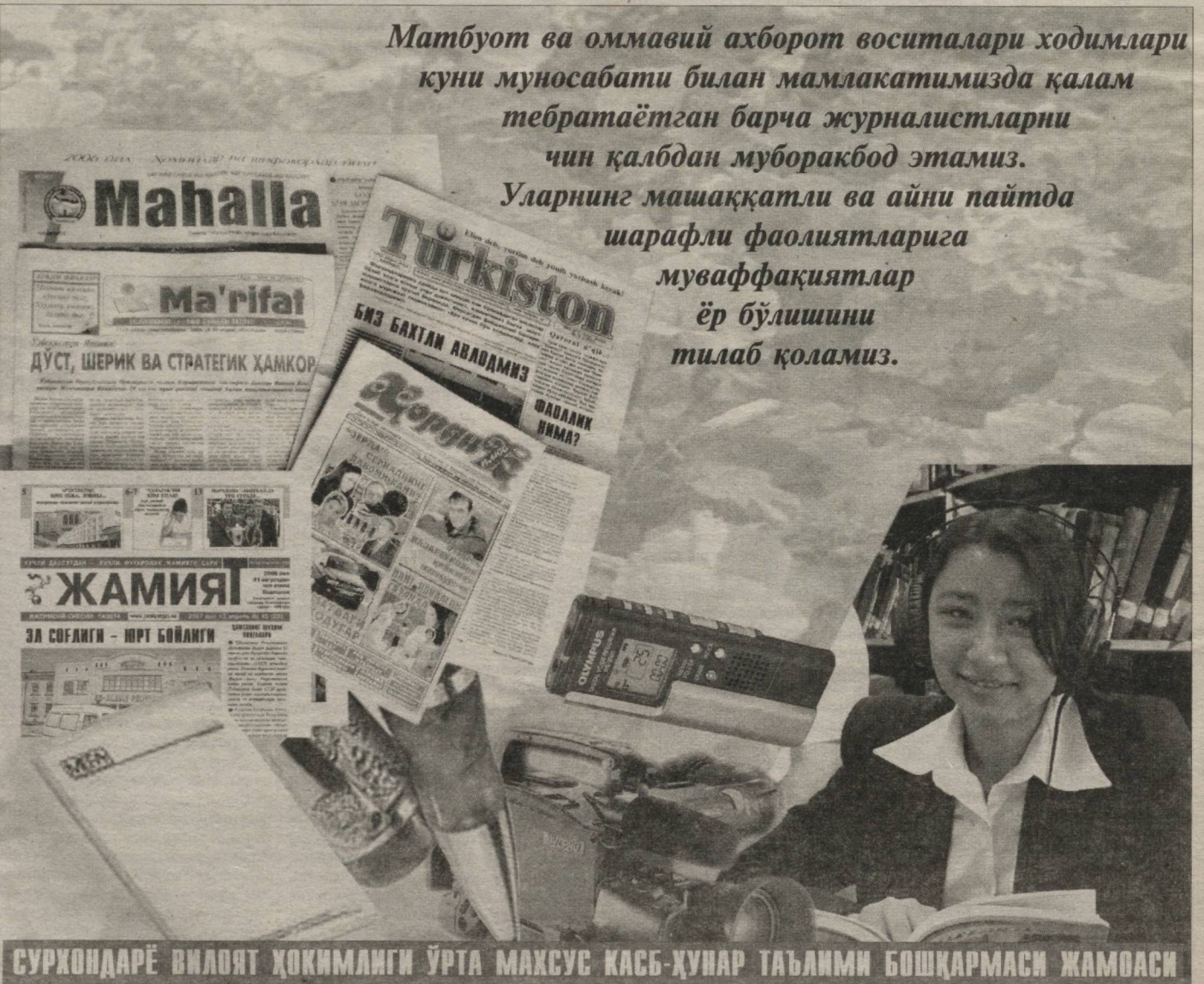
СУРХОНДАРЁ ВИЛОЯТ ҲОКИМЛИГИ ЎРТА МАХСУС КАСБ-ҲУНАР ТАЪЛИМИ БОШҚАРМАСИ ЖАМОАСИ

Матбуот ва оммавий ахборот воситалари ходимлари кунини муносабати билан мамлакатимизда қалам тебратаётган барча журналистларни чин қалбдан муборакбод этамиз. Уларнинг машаққатли ва айни пайтда шарафли фаолиятларига муваффақиятлар ёр бўлишини тилаб қоламиз.