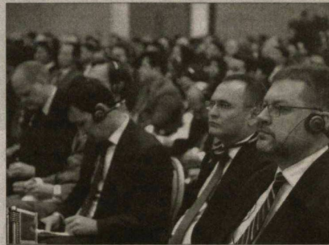
Президент также говорил о выпуске облигаций еще двух банков - НБУ, АКИБ «Ипотека-банк», что, в свою очередь, создаст крепкую основу для ускорения процессов по их интеграции в международные рынки капитала, привлечению долгосрочных ресурсов и диверсификации их ресурсной базы.

Цифровизация операционных процессов банков послужит сокращению операционных расходов, увеличению доходности банков и, соответственно, расширению их возможностей по дальнейшему совершенствованию IT-инфраструктуры. В этом контексте необходимо подчеркнуть, что основной целью цифровизации банков является повышение их операционной эффективности и доступности банковских услуг.