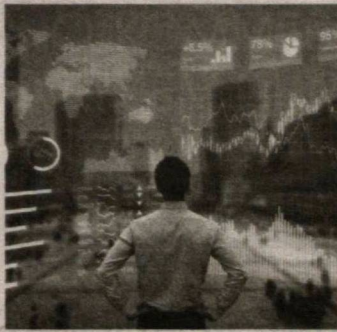
Президент Шавкат Мирзиёев 28 мая провел совещание, посвященное обсуждению приоритетных задач в обеспечении конкурентной среды в экономике и защите прав потребителей.

Глава государства подчеркнул, что в процессе перехода Узбекистана к ры-