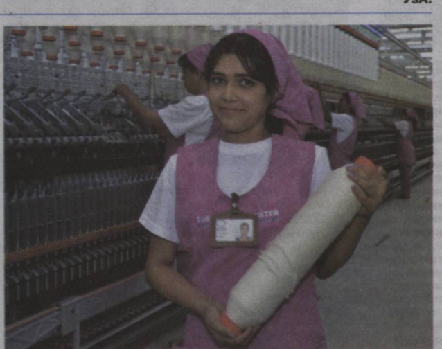
Қорҳои муштаракӣ Ўзбекистон ва Англия «Амудар текс», ки фаъолияти худро соли 2019 дар шаҳри Тирмиз оғоз намудааст, ба истеҳсоли ришта-қалоба аз ашёи хоми пахтаи дар шароити маҳаллӣ рӯёндашуда иқтисоднашуда шудааст. Чихоҳҳои замонавӣ ва ускунаҳои аз хориҷ овардашуда қуввати соле истеҳсолкунӣ 7 ҳазор тонна маҳсулоти босифатдорост. Алҳол ин 700 нафар бо қорҳои доимӣ банд мебошанд. Қорҳои хар сол содир намудани маҳсулоти арзишаш 10 миллион долларинаро ба нақша гирифтааст. Дар сурат: дар қорҳои «Амудар текс».

Мувофиқи рӯномаи қорабинӣ роҳбари мамлақати мо ба қорҳои муҳимтарини таъсиси ҳамаҷонибаи мутақобилан судманди тироятиву иқтисодӣ, қорҳои яқҷоя рафъ қардани бӯҳроне, ки дар натиҷаи пандемияи коронавирус ба амал омадаанд, диққат медиҳад. Интизор меравад, ки яқ қатор сарони давлатҳо ва ҳуқуматҳои кишварҳои хориҷӣ низ бо паёмҳои таъқилӣ баромад мекунад.