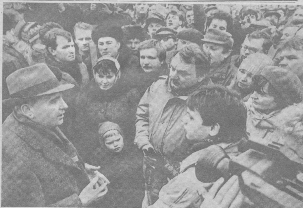
ВИЛЬНЮС. 11 январь. В. И. Ленин номли майдондаги учрашув.

ТАСС махус мухбирлари Э. ПЕСОВ ва А. ЧУМИЧЕВлар телесурати.