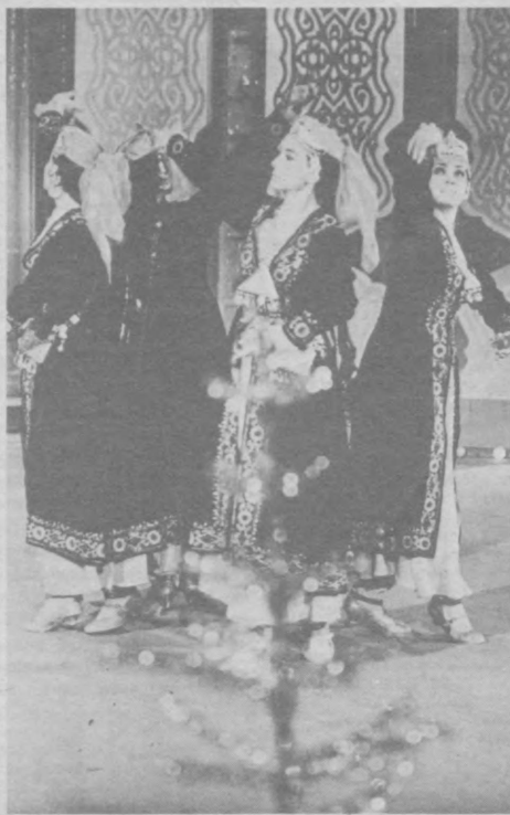
РАҚҚОСА ҚИЗЛАР. А. РИСҚИЕВ сурати (ЎзТАГ).