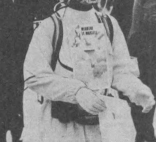
ШВЕЙЦАРИЯ. Бу ерда Альп клуби аъзолари киш келиши билан ўз машиналарини бошлаб юборишади.