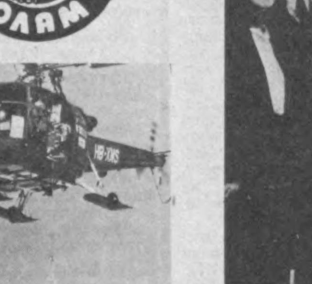
ШВЕЙЦАРИЯ. Бу ерда Альп клуби аъзолари киш келиши билан ўз машиналарини бошлаб юборишади.