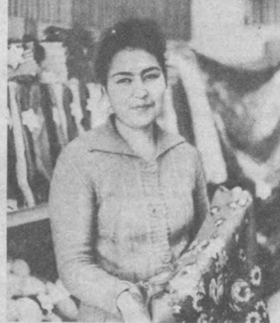
БЕКОВОДА халқ тўғричилигининг турли тармоқларда самаралар кўрсатган пещадим ишчилар қўллаб топилади. Улар ишлаб чиқаришда, тизмат соҳаларидаги жомуурликлар билан элде обрў топиб келмоқдалар. Ушбу суратларда