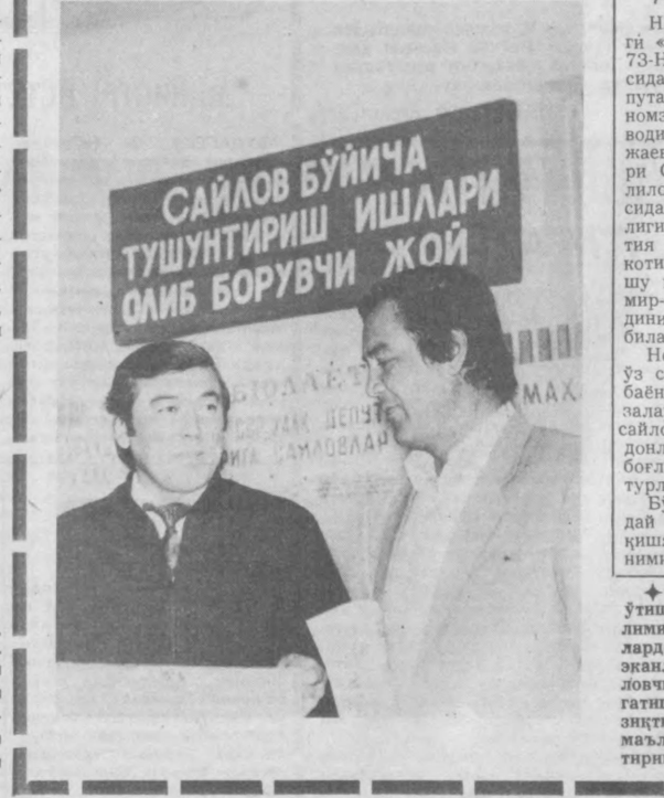
Сайлов буйича тушунтириш ишлари олиб борувчи жой