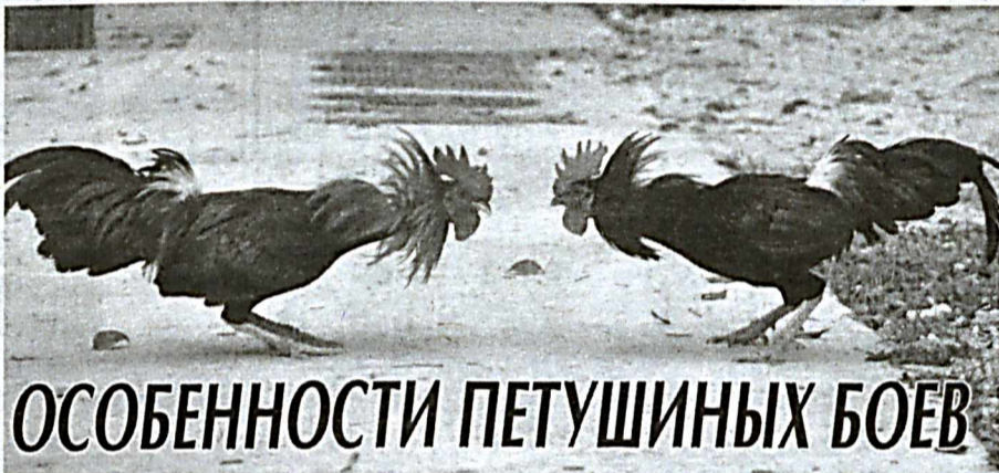
ОСОБЕННОСТИ ПЕТУШИНЫХ БОЕВ