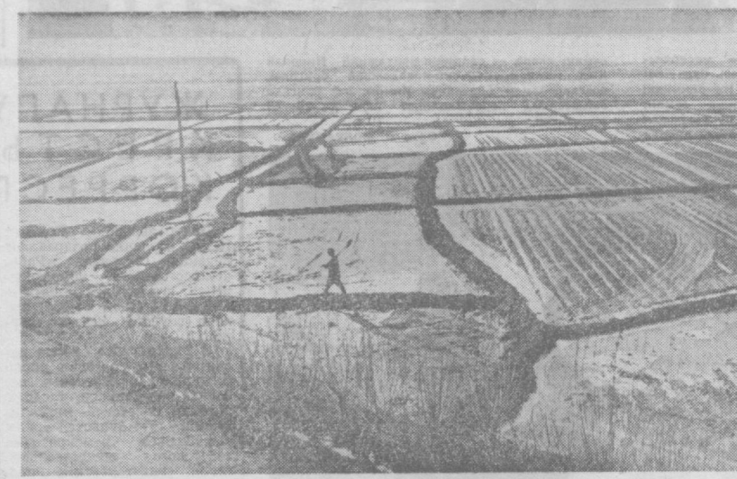
На снимке: промышленные поля в колхозе «Коммунизм» гурленского района. В минувшем году земледельцы колхоза собрали по 40 центнеров хлопка с гектара и сдали 6.177 тонн сырья. Ныче они намерены порадовать Родину еще большим урожаем.

НА ОДНОЙ из строительных площадок Маргилана построен обычный крупнопанельный дом. Десяти таких жилых домов возводит здесь Ферганский домостроительный комбинат. Но привычна в этом здании только внешность. Во внутренней отделке квартир применена новинка — линолеумные полы, которые были изготовлены в мастерских и доставлены на объект в виде готовых «ковров» размером на комнату. С помощью чистителю организации, механизации и