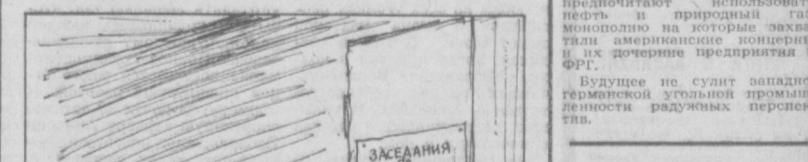
Обычный багаж сайгонской администрации. Рис. Я. ТАБАЧНИОА.

Министерство иностранных дел СССР ожидает, что китайская сторона примет необходимые меры к немедленному прекращению посягательств на иммунитет советских дипломатов и к освобождению китайскому руководству для