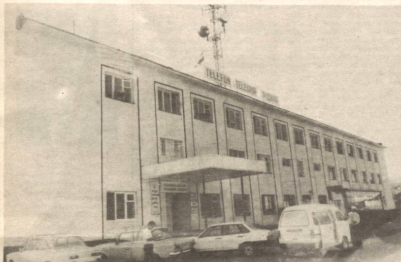
«Тошкент Телеком» ХЖнинг Янгийўл филиали биноси.