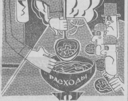
Большая ложка Пентагона. Рис. М. САМОЙЛОВА.

На сенате Соединенных Штатов лежит сейчас большая ответственность за то, будут ли развиваться советско-американские отношения и дальше в направлении разрядки или же будет создано еще одно препятствие на пути нормализации этих отношений.