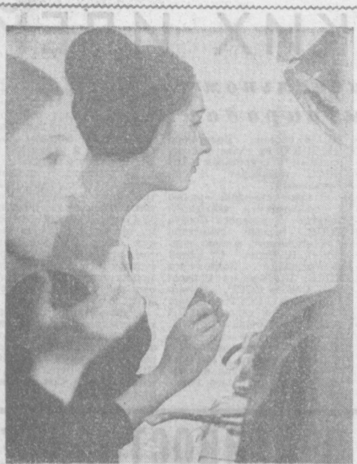
В Ташкентском театре оперетты. Перед выходом на сцену.

ЭТО здание из мрамора, металла и стекла отныне будет вмещать в себя фонды Государственного музея искусств Узбекской ССР. Фонды эти поистине колоссальны. По принятым экспозициям нам знакома лишь незначительная часть коллекций. Ведь, кроме многочисленных произведений графики, живописи и скульптуры, здесь накоплено немало ценнейших этнографических материалов. Только литературных фоліонов и прикладного искусства, исследований, альбомов, иллюстраций к книгам — более двадцати тысяч названий. Есть еще и громадная фототека, есть и пять тысяч диапозитивов.