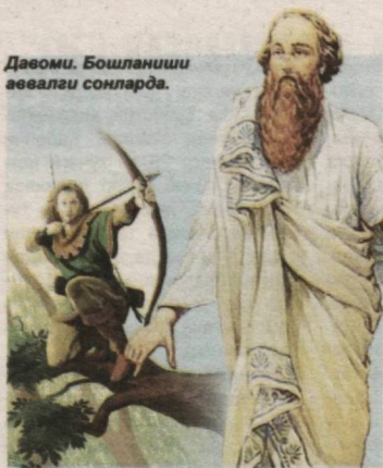
Давоми. Бошланиши аввалги сонларда.