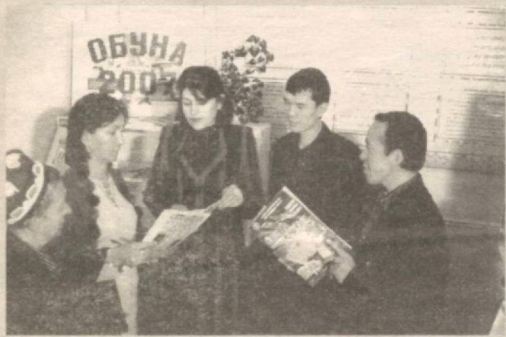
Алоқа тармоғида тез-тез йиғилишлар ўтказилиб, амалга оширилган ишлар муҳокама қилинади, келгуси режалар белгилаб олинади.

Андижон шаҳар почта алоқаси тармоғида 176 нафар ходим меҳнат қилмоқда. Улар томонидан 350 минг аҳолига газета-журналлар, хат-хабар ва жўнатмалар, 38 мингдан ортиқ пенсионерларга пенсия пуллари ўз вақтида етказиб берилмоқда.