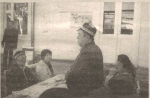
Бир пиёла чой устида бўлиб ўтган очиқ мулоқотда матбуот нашрларига обунани давом эттириш масаласи муҳокама қилинди.

Яқинда тармоқнинг 32-алоқа бўлимида ўтказилган шундай йиғилишга шаҳардаги маҳаллалар фуқаролар йиғини раислари ва фаоллари, мутасадди ташкилот раҳбарлари ҳамда жамоатчи обуначилар таклиф этилди.