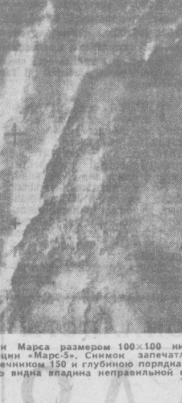
На этой фотографии, сделанной станцией «Марс-5», виден кратер с плоским дном...