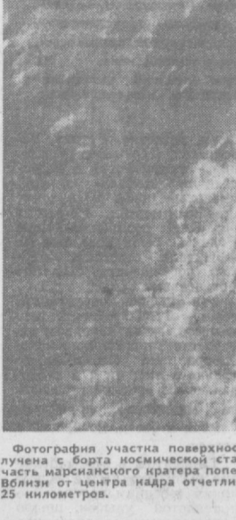
Фотография участка поверхности Марса размером 100x100 километров...

500 километров, а в высоту, по некоторым данным, — более 20 километров. Такой громадной горой не может похвастаться Земля!