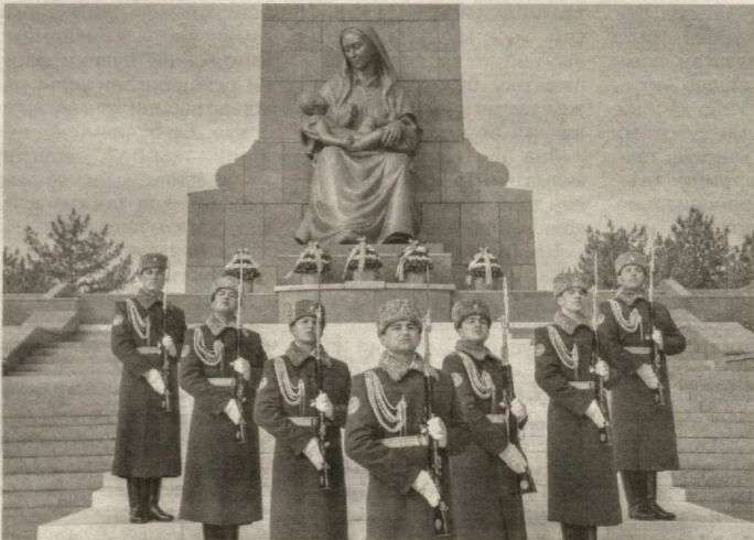
(Давоми. Боши 1-бетда.)

...13 январь куни эрталаб Мустақиллик майдонида Мудофаа, Ички ишлар ва Фавқуллода вазиятлар вазирликлари, Миллий хавфсизлик хизмати, Давлат бохжона кўмитаси вакиллари саф тортди.