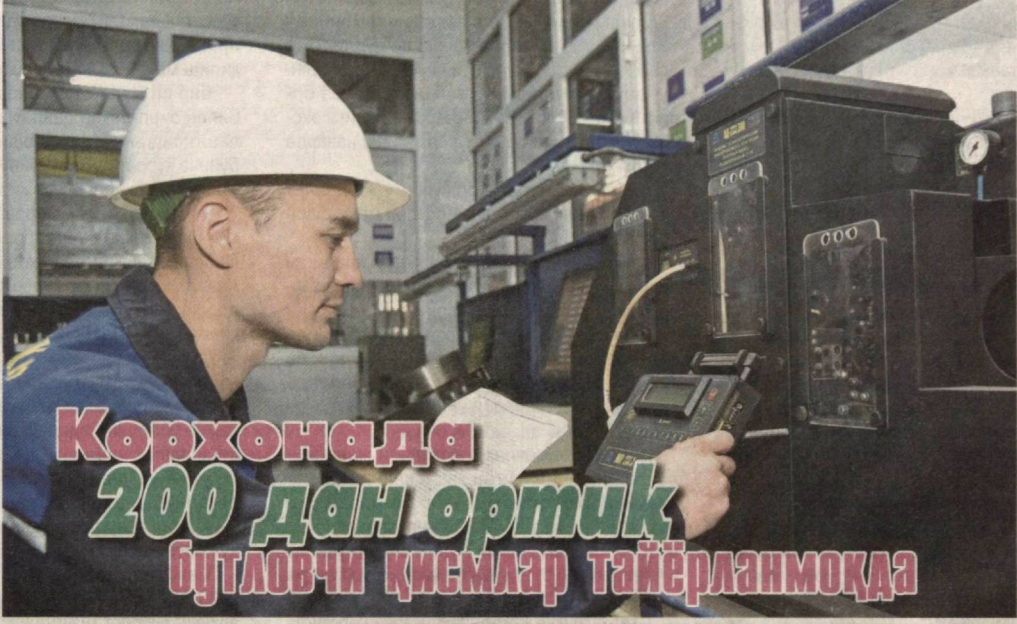
Корхонада 200 дан ортиқ бутловчи қисмлар тайёрланмоқда

"Ўзбекистон темир йўллари" акциядорлик жамиятининг "Қуюв механика заводи" шўъба корхонасида 200 турдан ортиқ бутловчи қисмлар тайёрланмоқда.