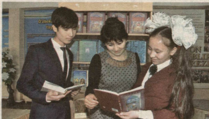
(Давоми. Боши 11-бетда.)

таълим сифати ва муаммолар ечимига ижобий таъсир кўрсатмоқда