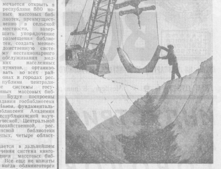
Коллектив передовиков механизированной колонны № 1 треста «Андинвестстрой», который несет высокие традиции коллектива коммунистического труда, был инициатором движения «XXV съезду — 25 ударных декад». Он досрочно выполнил пятилетний план, за минувшие годы освоено 5,470 гектаров новых земель Центральной Ферганы, на 177 километрах оросительные проломы железобетонные лотки, построено около 20 тысяч квадратные метры жилья. На снимке: монтаж железобетонных лотков.

Но, по достижению отмечая достижения, мы все-таки главное внимание должны уделять еще не решенным проблемам библиотечного обслуживания. О них шла речь в постановлении ЦК КПСС «О повышении роли библиотек в коммунистическом воспитании трудящихся и научно-техническом прогрессе». В Узбекистане около семидесяти населенных пунктов с числом жителей пятисот и более человек не имеют массовых библиотек. В десятой пятилетке на-