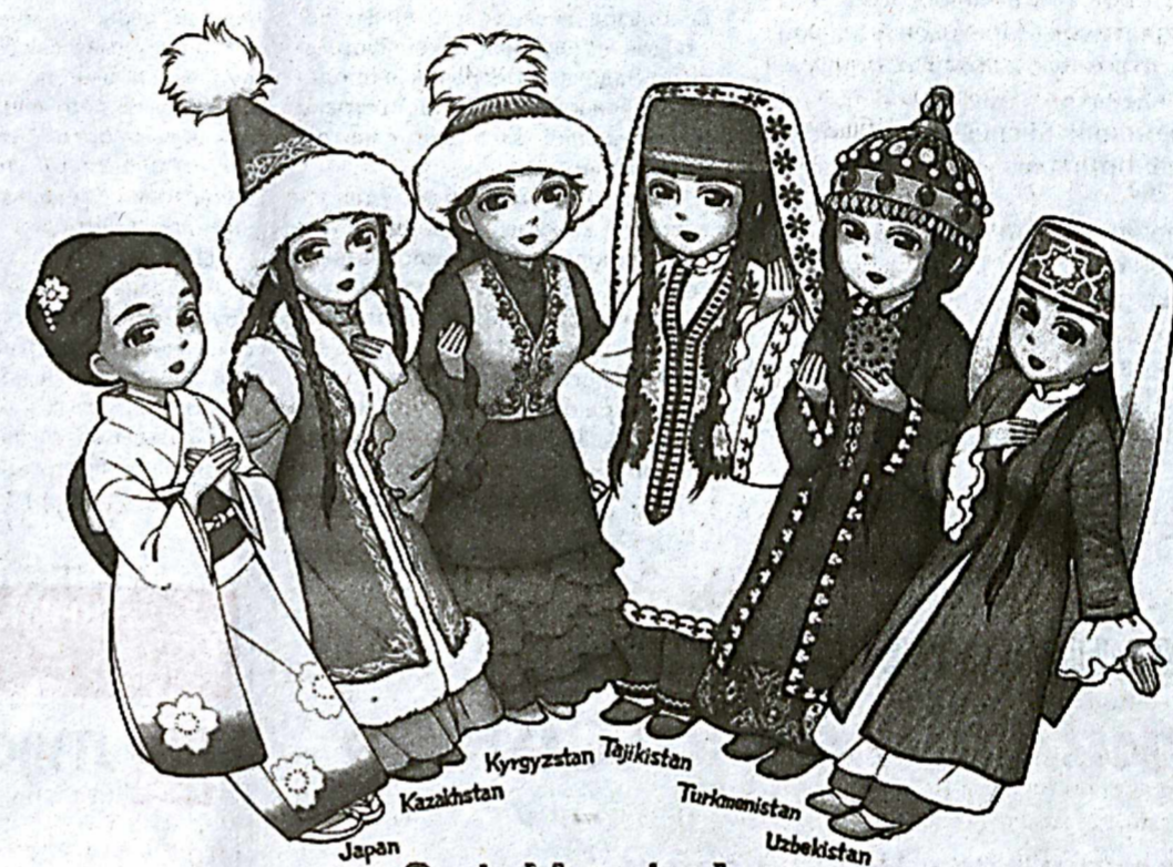
Central Asia plus Japan

Помимо предоставления кредитов, проводятся тренинги для персонала по обслуживанию и эксплуатации подобных новых систем производства электроэнергии, таким образом, оказывается комплексное содействие по распространению и созданию высококачественной инфраструктуры в Узбекистане.