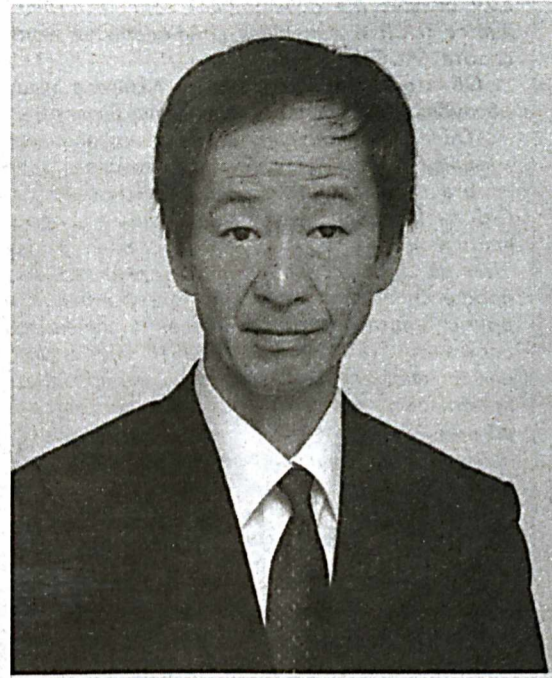
Чрезвычайный и Полномочный Посол Японии в Республике Узбекистан г-н Нобуаки ИТО

В январе этого года Япония и Узбекистан отметили 25-летие установления дипломатических отношений, по случаю чего Премьер-министр С. Абэ и Президент Ш. Мирзиёев, а также министры иностранных дел Ф. Кисида (занимавший этот пост в то время) и А. Камиллов обменялись поздравительными посланиями. На протяжении 25 лет Япония последовательно развивает дружественные узы, и в настоящее время стратегическое партнерство между двумя странами находится на высоком уровне.