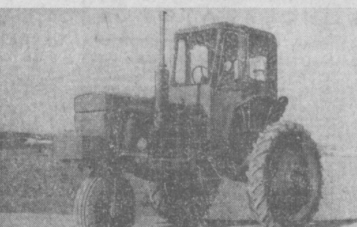
Вот он, новый трактор!

В нынешнем году предприятие изготовит свыше 20 тысяч таких машин. Кроме того, завод будет выпускать еще два вида тракторов: модернизированный четырехколесный марки Т28Х4М-С с шестым колесом и четырехколесный трактор Т28Х4М-С1, который раз-