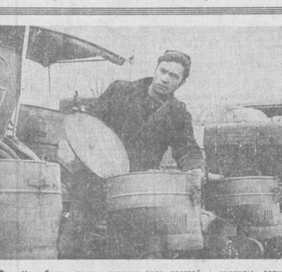
Чем ближе весна первого года десятой пятилетки, тем выше накал предпосылок работ в колхозе «Леннинский Янгильювского района. Полным ходом идут подготовочные работы: сетки, планировка карт, заготовка удобрений. До посева кониция доведены семена. На линейку готовности полностью поставлены посевные агрегаты. Народные кон-