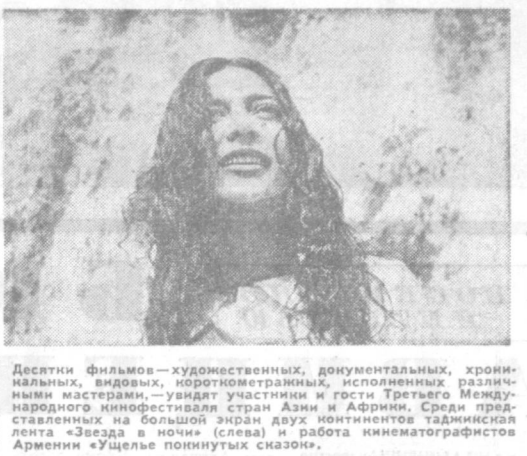
Десяти фильмов — художественных, документальных, хроникальных, видовых, короткометражных, исполненных различными мастерами, — увидят участники и гости Третьего Международного кинофестиваля стран Азии и Африки. Среди представленных на большой экран двух континентов таджикская лента «Звезда ночи» (слева) — работа кинематографистов Армении «Ущелье покинутых сказок».