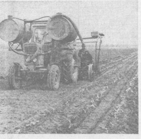
Завершают высевку в грунт рассады капусты ранних сортов овощеводы колхоза имени Брежневца Калининского района. Одновременно они высевают в грунт и рассаду помидоров. На снимке: механизированная посадка рассады.

Почин москвичей подхвачен Земельщики ордена Трудового Красного Знамени колхоза «Ленинград» Сырдарьинского района решили в день субботника начать первый цикл междурядных обработок хлопчатника, отремонтировать полевые станы, благоустроить и озеленить территорию центральной усадьбы. Первую комплексную обработку посевов хлопчатника намечают развернуть в день «красной субботы» и труженики совхозов «Баяут», имени Пушкина, имени Гагарина, имени Титова и многих других хозяйств. Будут проводиться также благоустроительные и озеленительные работы. Коллектив передового в области Бактского автотрепприятия № 52 объявляет перевезти несколько тысяч тонн сверхпланового груза. Многие шоферы будут работать на сэкономленном горючем. На Гулистанской швейной фабрике швей-мотористки берут индивидуальные обязательства. Так, швея Р. Самигуллина решила в день субботника сшить 134 комплекта школьной формы и заработанные средства передать в фонд пятилетки. А. ХАЙРУТДИНОВ.