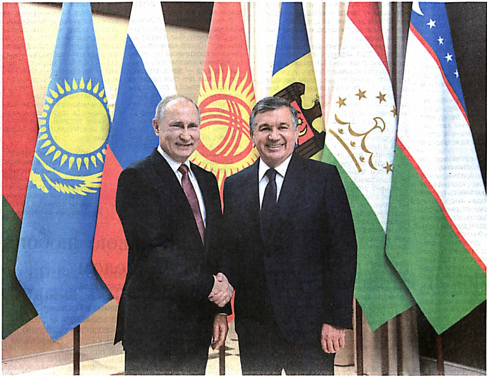
Президент Республики Узбекистан Шавката Мирзиёева в резиденции Ново-Огарево встретил Президент Российской Федерации Владимир Путин.

Президент Республики Узбекистан Шавкат Мирзиёев 26 декабря 2017 года принял участие в неформальном заседании Совета глав государств—участников Содружества Независимых Государств в Москве.